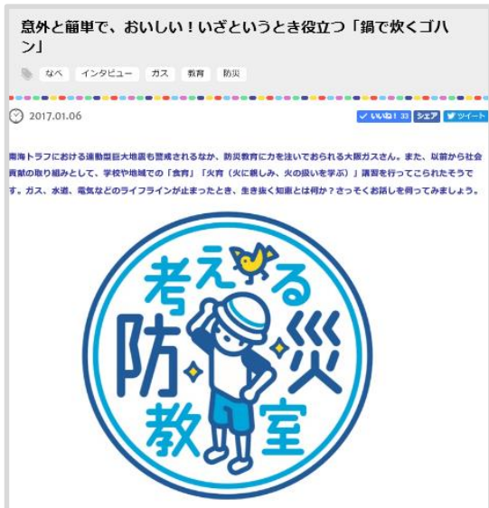
«大阪ガス株式会社 様»