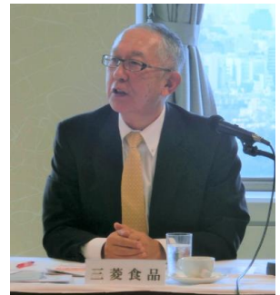
外国人の受入れに関する委員会 3月1日(金) 東海大学校友会館