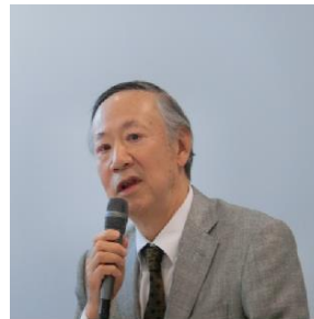
「エネルギー・原発問題」委員会 3月5日(火) 紀尾井カンファレンス