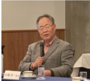
「国家財政の見える化」委員会 2月26日(火) 国際文化会館

「国家財政の見える化」についての有識者との意見交換や海外事例の紹介など、これまでの取り組みを振り返り、次年度の活動計画について議論を行いました。