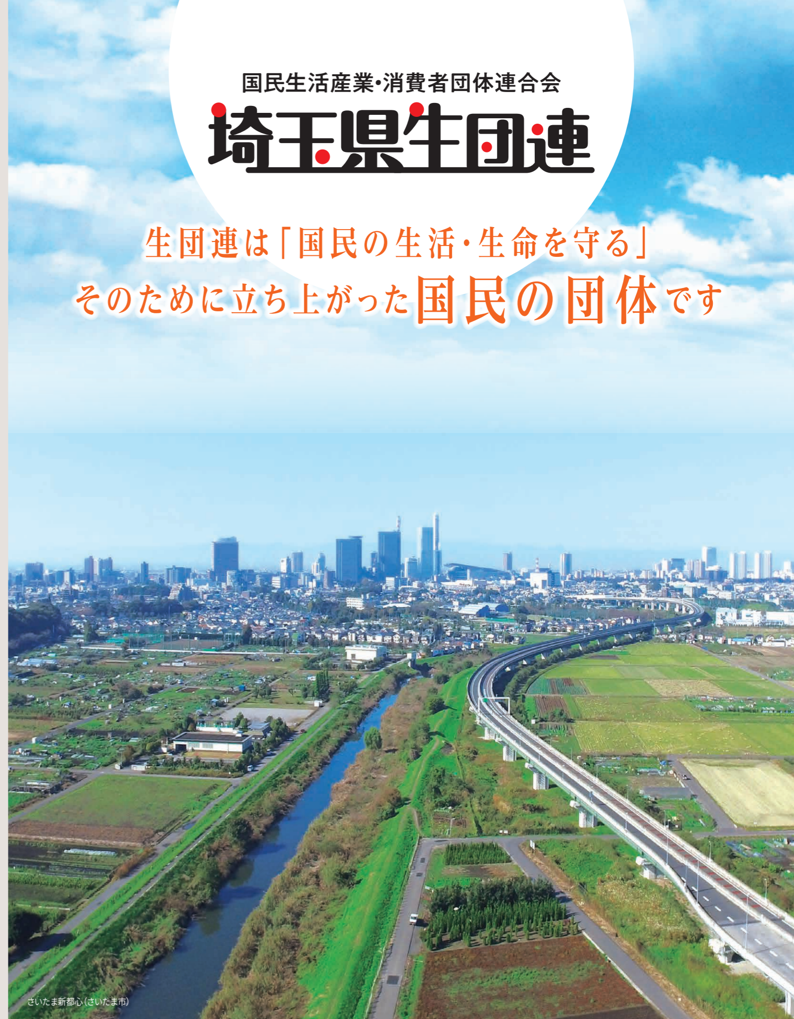
さいたま新都心(さいたま市)