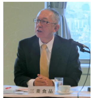
外国人の受入れに関する委員会 3月1日(金) 東海大学校友会館