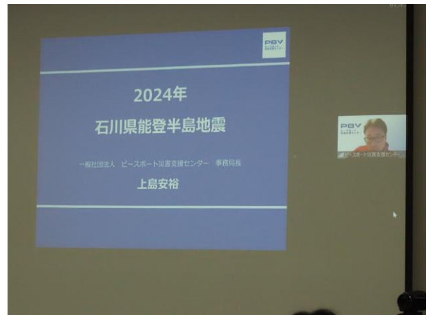
▲一般社団法人ピースポート災害支援センター活動報告