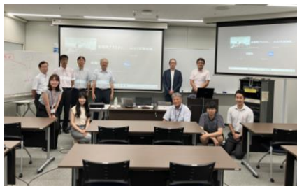
▲プラスチックの未来を考える会 会員の皆様（一部）