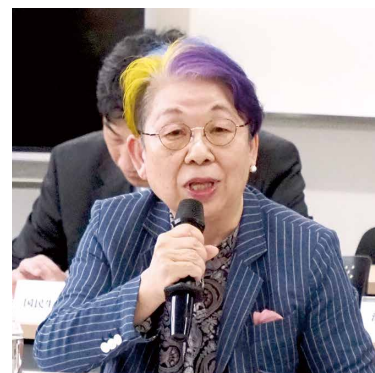
▲阿南部会長 兼 消費者部会長