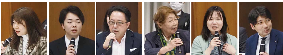
▲発言される委員の皆様(ほかにも多くの方からご意見をいただきました)