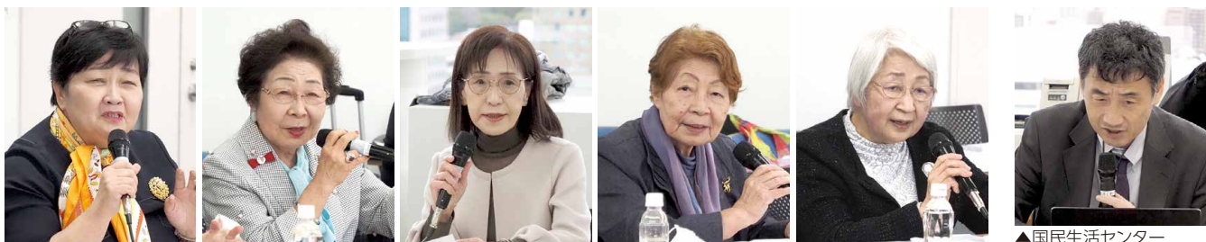
▲ご発言いただいた方々(一部)

AI は今後確実に進展するので、活用を前提に考えるべき。一方でフェイクニュースなどのリスクもあり、情報を疑い、真偽を見極める力が重要。消費者にとってはエビデンスを確認する力が不可欠である。