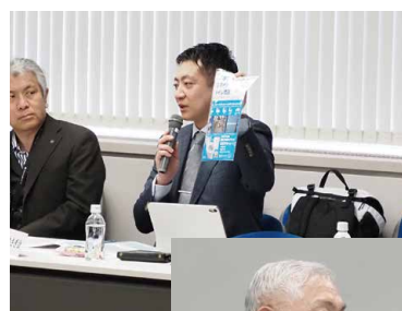
▲▲ 委員会参加者からの 報告の様子